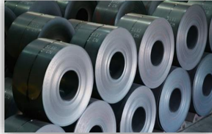
لفات الحديد المسحوب على الحار (الأسود)